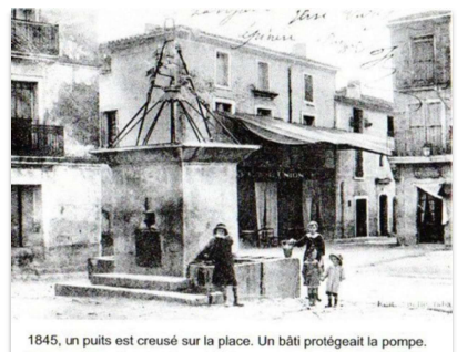
1845, un puits est creusé sur la place. Un bâti protégeait la pompe.

C'est en 1845 qu'un puits circulaire est creusé sur la place. Une première pompe est installée avec un bâti pour la protéger, car dessous il y a un courant très fort et rapide.