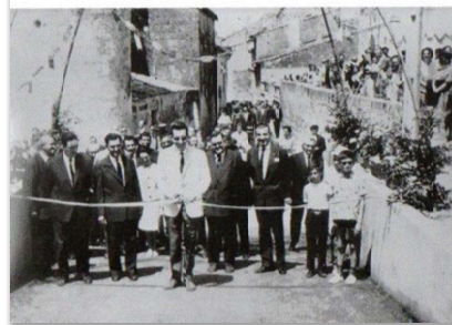
Inauguration du château d'eau 1963

Les travaux se déroulent entre 1962 et 1963 et se terminent par l'inauguration du château d'eau et du terrain de sport. A cette occasion un repas est offert à la population.